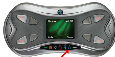
Ikona starostlivosti o vodu

Vodorovný graf na obrazovke water care poskytuje merania systémového statusu. Ak je ukazovateľ statusu zelený, fungovanie ACE systému je optimálne. Ak je status žltý alebo červený, systém si vyžaduje pozornosť.